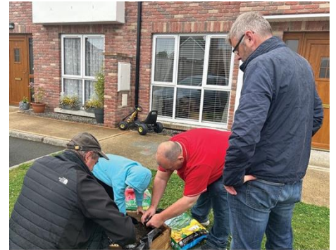
Trabajando duro plantando bulbos

Si se siente inspirado por esta iniciativa y desea recibir ayuda en su propio proyecto, póngase en contacto con el servicio de asistencia llamando al 01 820 0002 y pregunte por su responsable de Vivienda o envíe un correo electrónico a supportdesk@neha.ie .