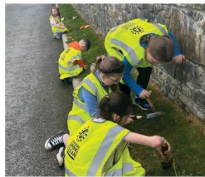
Día de limpieza