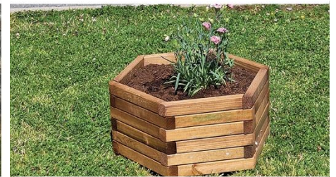
Flores de verano en las macetas