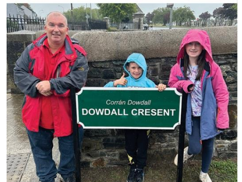
Nueva señal en la entrada de la urbanización